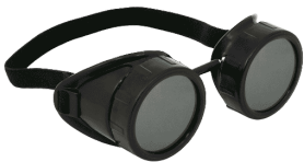
Gafas para Oxicorte Código INFRA: 8185