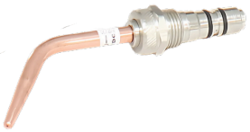
Boquilla para soldar Cromada #3 (2.4 mm)